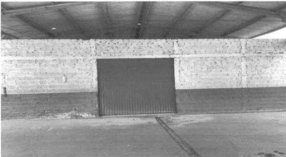
divisão ao meio do barracão