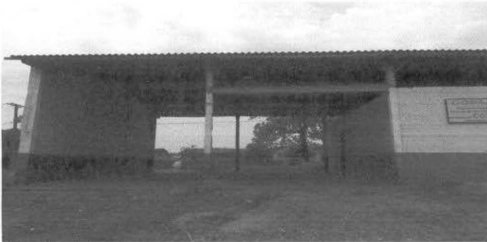
fundos do imóvel