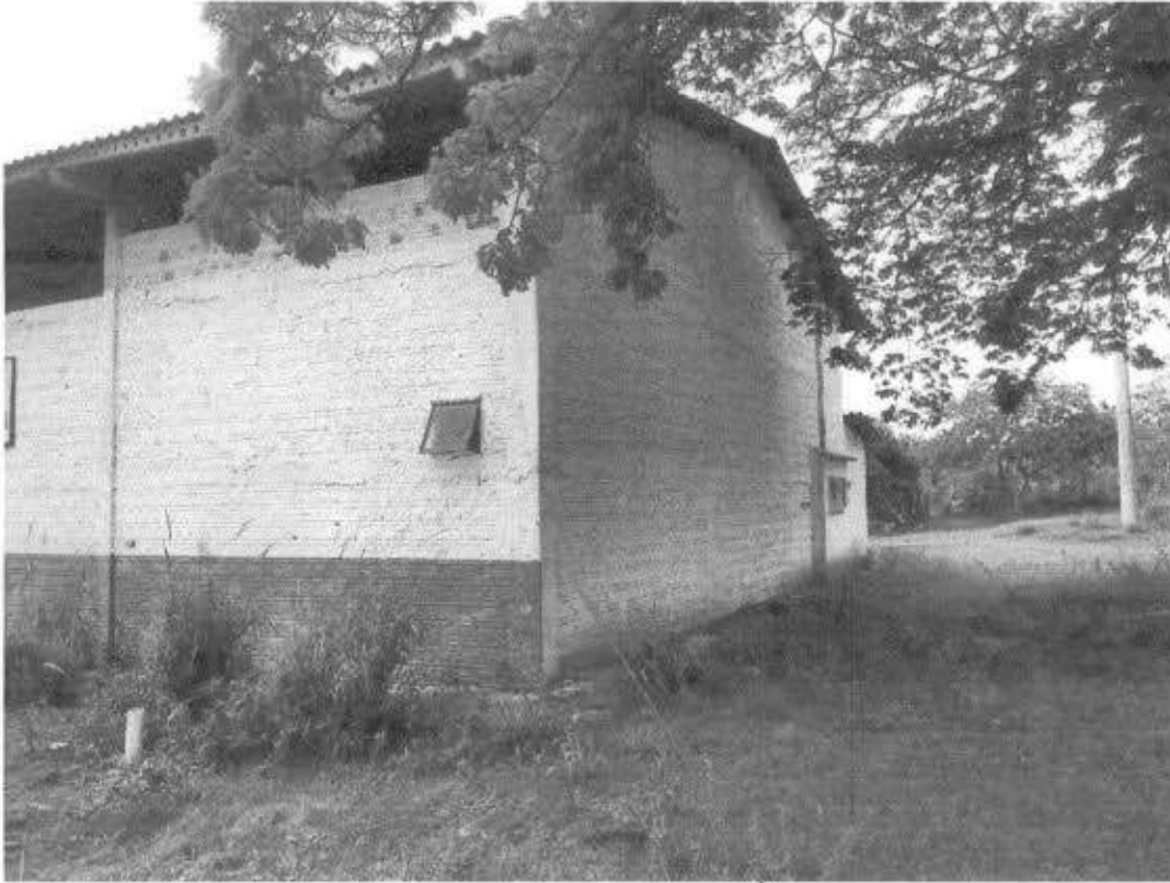
Parte lateral e fundos

As fotos abaixo mostram os fundos do barracão