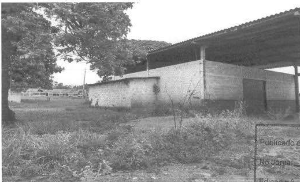
Frente do imóvel